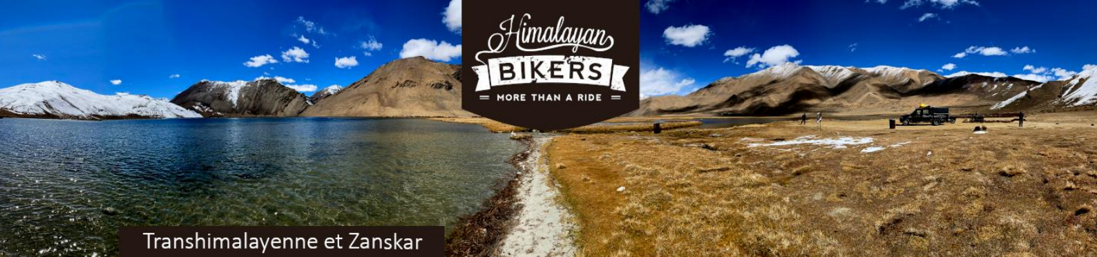
Transhimalayenne et Zaskar